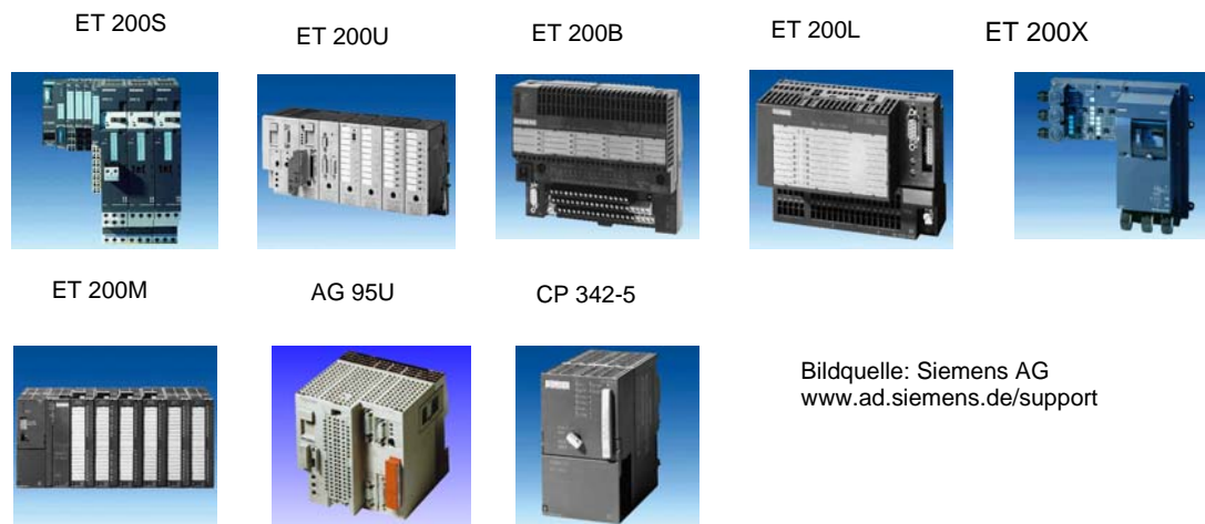
Bild 2.2-3 : Beispiele aus dem „großen Warenkorb“ an Simatic S7 - Geräten für die dezentrale Ansteuerung über Profibus-DP, rechts unten der spezielle Kommunikationsprozessor CP 342-5

Beispiel für DP-Baugruppen des Systems Simatic zeigt Bild 2.2-3 :